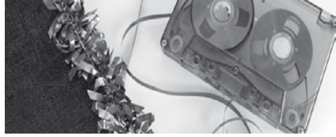
Tela dos Traxes Sonoros de Galicia presentes na exposición grazas á Cidade da Cultura de Galicia

Inauguración da Exposición O disco é NORMAL Unha introdución á historia do soporte sonoro e á súa incidencia no mundo da música, a arte plástica e a sociedade do século XX.